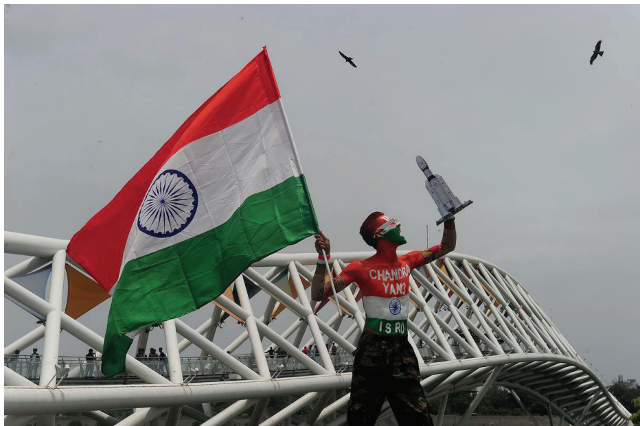
සඳෙහි දක්ෂිණ ධ්‍රැවය මෙතරම් වැදගත් වන්නේ ඇයි?

2019 දී ඉන්දියාවේ පෙර උත්සාහය අසාර්ථක වූයේ ලැන්ඩරය එහි අවසාන බැසයාමේදී කඩා වැටීමෙනි. විද්‍යාඥයන් එම වැරද්දෙන් ඉගෙන ගත් අතර වන්ද්‍රයාන්-3 සඳහා බොහෝ වැඩිදියුණු කිරීම් සිදු කළහ. මෙම සාර්ථක ගොඩබැඳීම සමඟ ඔවුන්ගේ වෙහෙස මහන්සියේ ප්‍රතිපල සාර්ථක විය.