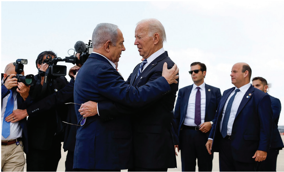
කටයුතු කරන බවය. එසේම ඊට එරෙහිව අවි ඔසවන සියලු දෙනාට එරෙහිව සටන් වැදීමට තමන් සුදානම් බවද ඔහු අවධාරණය කරයි.

ඊශ්‍රායලේ ආරක්ෂක හමුදාවේ මාණ්ඩලික ප්‍රධානී, ලුතිනන් ජෙනරාල් හර්සි හැලෙව් සිය හමුදා සොල්දාදුවන්ට උපදෙස් දී ඇත්තේ, “දැන් අපගේ වගකීම වන්නේ ගසා තීරයට ඇතුළුවීම, හමාස් සංවිධානය සුදානම් කරන, ක්‍රියා කරන, සැලසුම් කරන සහ ප්‍රහාර දියත් කරන ස්ථාන ඉලක්ක කරන්න. සෑම තැනකම ඔවුන්ට පහර දෙන්න, සෑම අණ දෙන නිලධාරියෙක්ම, සෑම ක්‍රියාකාරයෙක්ම යටිතල පහසුකම් විනාශ කරන්න. තනි වචනයෙන් කියනවා නම්, දිනන්න.” කියාය. ඔහු තවත් වරෙක ප්‍රකාශ කර සිටියේ, අප ජයග්‍රහණය අත්කරගත යුතු බවත් ඒ සඳහා ඊට විරුද්ධ සියලු දෙනාට එරෙහිව සටන් වදින බවය. එසේම ගසා තීරය අත්පත් කරගැනීම වෙනුවෙන් ගත හැකි සියලු පියවර ගැනීමට